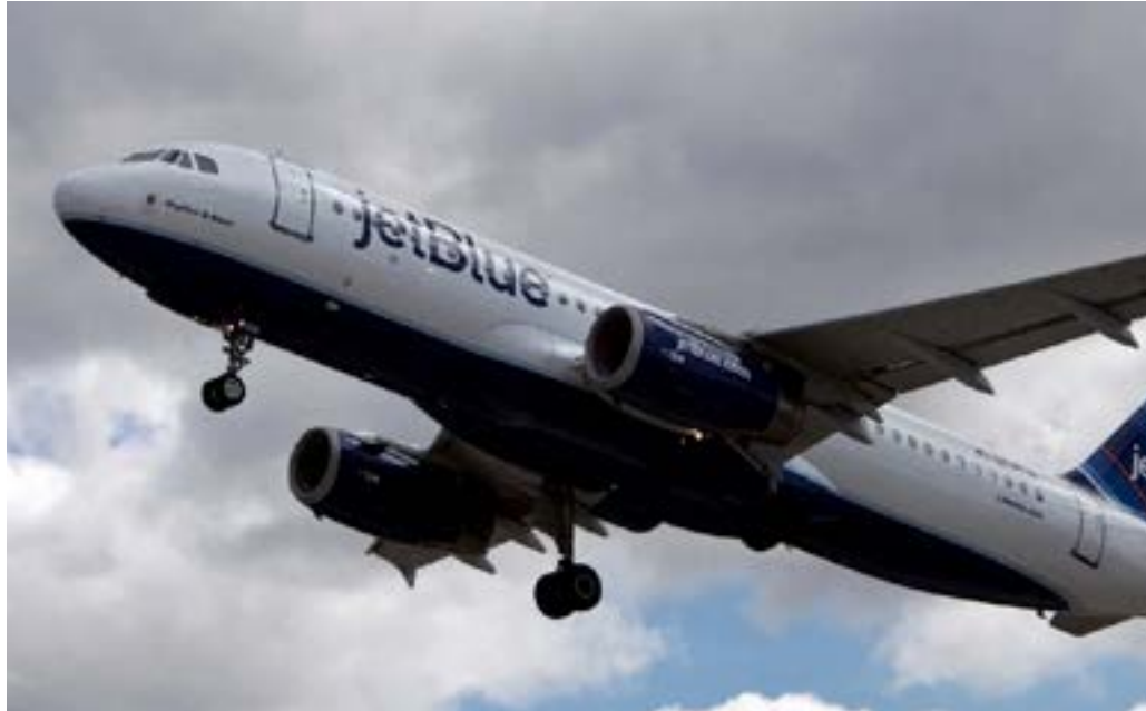
JetBlue planea adquirir Spirit Airlines por 3.800 millones de dólares